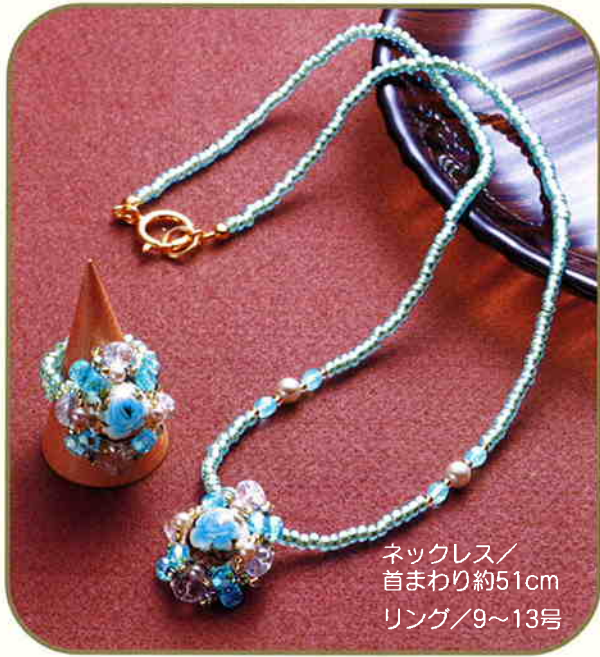
ネックレス/ 首まわり約51cm リング/9~13号

※写真は実物大ではありません。 ※写真の色は実物と多少異なる場合があります。 ※難易度・所要時間は作品作製の目安としてご参照下さい。