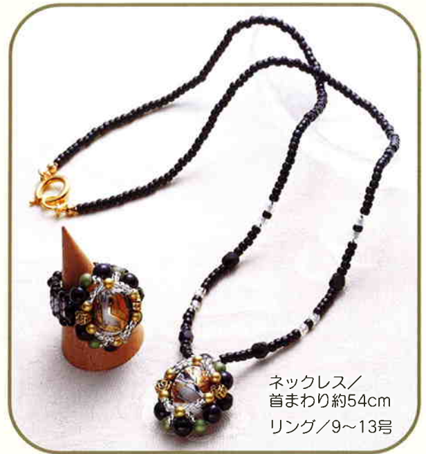
ネックレス/ 首まわり約54cm リング/9~13号