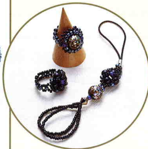
リング(2種)/9~13号 ストラップ/長さ約14cm