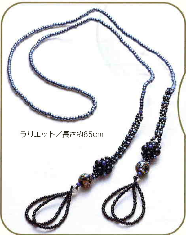
ラリエット/長さ約85cm