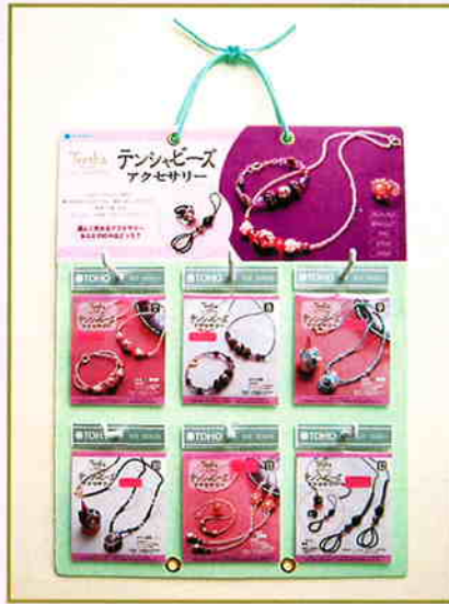
ディスプレイ寸法：縦約40cm×横約31cm