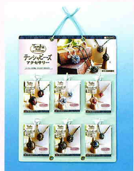
ディスプレイ寸法/縦約40cm×横約31cm