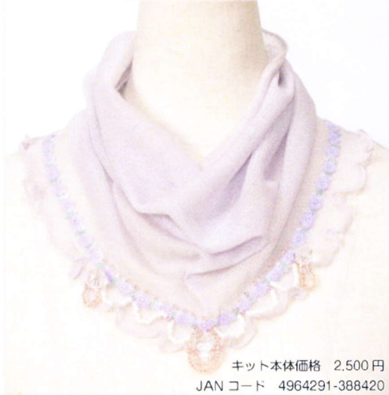
4. ラベンダーローズ