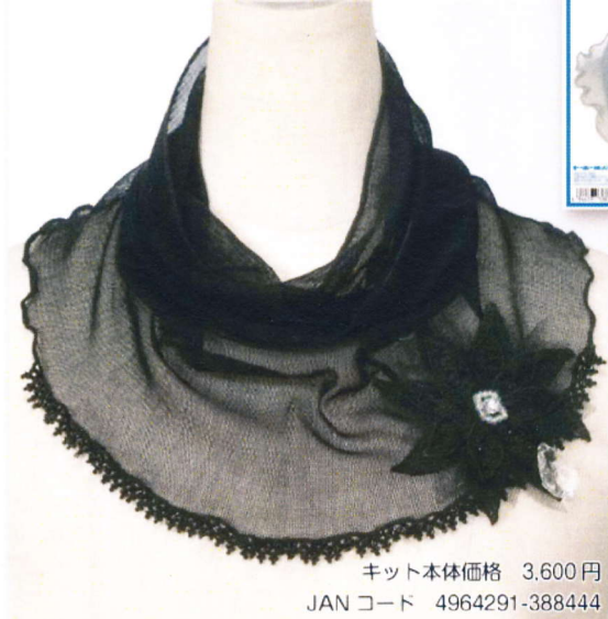
6. ニードルエイジングミニクロス