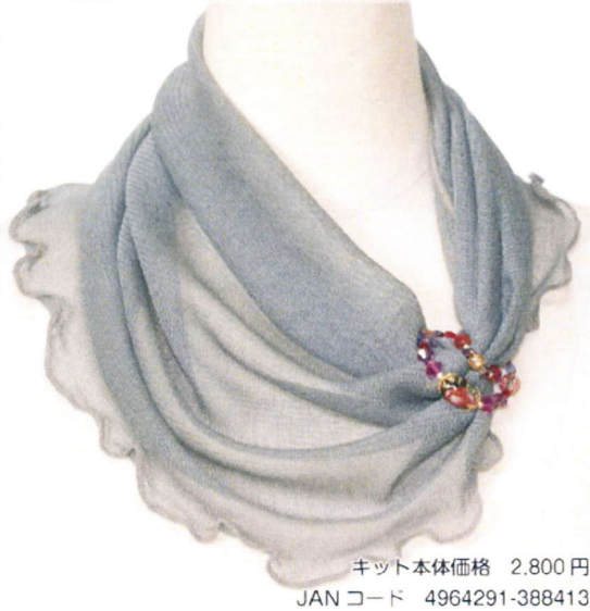
3. テンシャビーズネックジュエリー