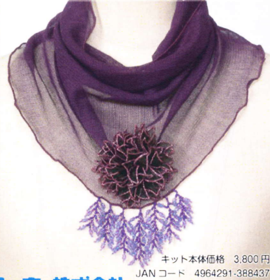
5. ニードルエイジングスプリングローズ