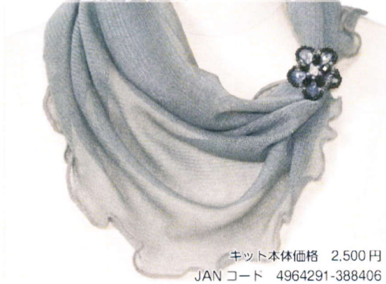
2. フラワーネックジュエリー