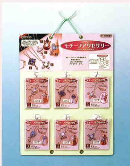
ディスプレイ寸法：縦約40cm×横約31cm