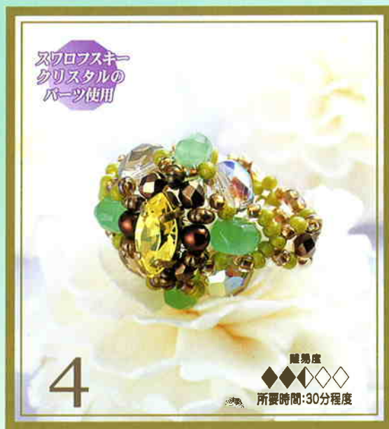
指輪サイズ: 9~13号 (指まわり約5~5.5cm) JANコード4964291-374928 税込価格 1,575 円 (本体価格 1,500円)