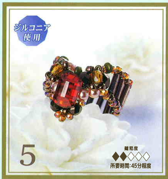
指輪サイズ：9～13号 (指まわり約5～5.5cm) JANコード4964291-374935 税込価格 1,575円 (本体価格 1,500円)