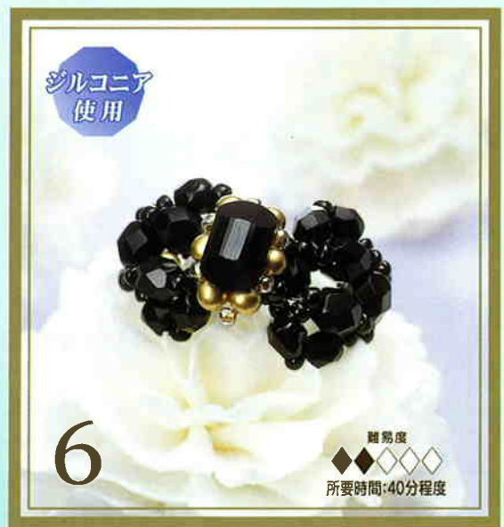
指輪サイズ：9～13号 (指まわり約5～5.5cm) JANコード4964291-374942 税込価格 1,575円 (本体価格 1,500円)