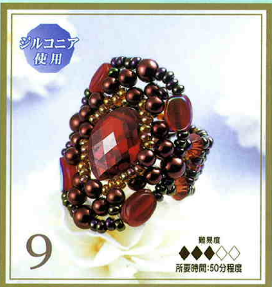
指輪サイズ：9～13号 (指まわり約5～5.5cm) JANコード4964291-374973 税込価格 1,890円 (本体価格 1,800円)