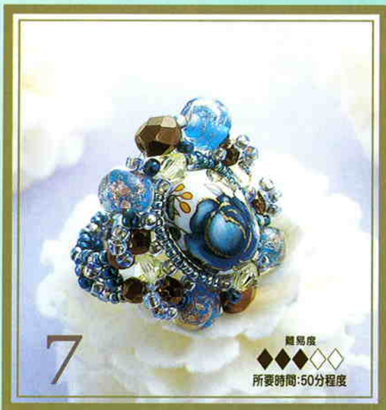
指輪サイズ：9～13号 (指まわり約5～5.5cm) JANコード4964291-374959 税込価格 1,575円 (本体価格 1,500円)