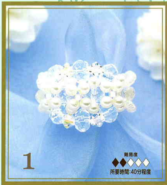
指輪サイズ: 9~13号 (指まわり約5~5.5cm) JANコード4964291-374898 税込価格 1,050 円 (本体価格 1,000円)