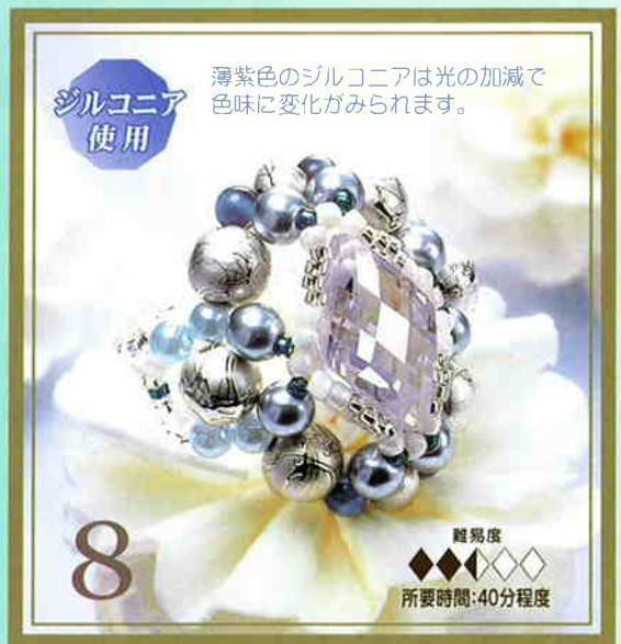
指輪サイズ：9～13号 (指まわり約5～5.5cm) JANコード4964291-374966 税込価格 1,890円 (本体価格 1,800円)