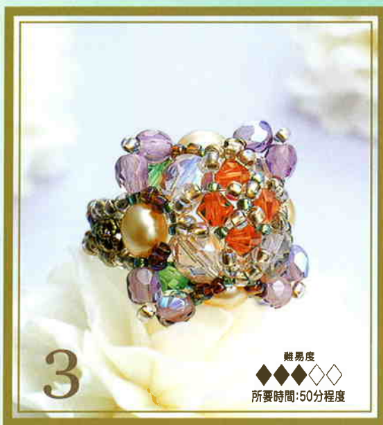
指輪サイズ: 9~13号 (指まわり約5~5.5cm) JANコード4964291-374911 税込価格 1,575 円 (本体価格 1,500円)