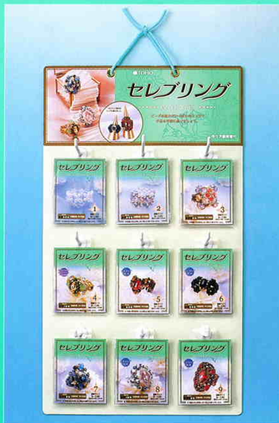
ディスプレイ寸法：タテ54cm×ヨコ31cm