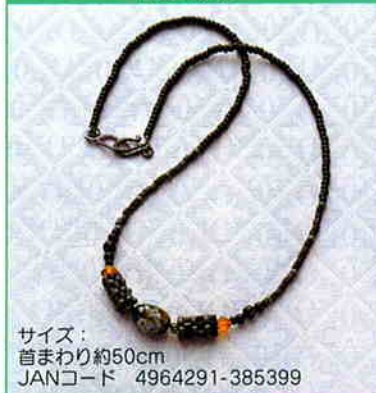
YS-6A チューブベヨーテステッチの ネックレス