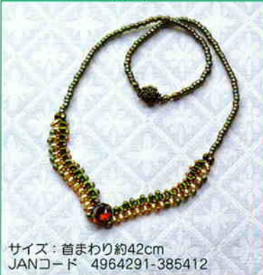
YS-7A シェブロン・チェインステッチの ネックレス