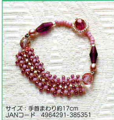
YS-4A ライトアングルウィーブの プレスレット