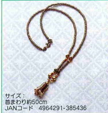
YS-8A ヘリンボーンステッチの ペンダント