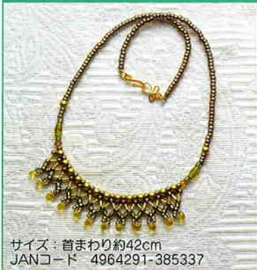
YS-3A ネットिंगのネックレス