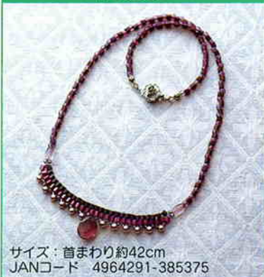
YS-5A ブリックステッチの ネックレス