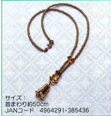
YS-8A ヘリンボーンステッチの ペンダント