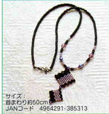
YS-2A ベヨーテステッチの ペンダント