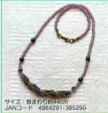
YS-1A スパイラルロープの ネックレス