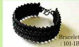
Bracelet : 101-1B