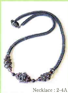
Necklace : 2-4A