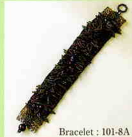
Bracelet : 101-8A