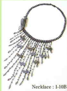
Necklace : 1-10B