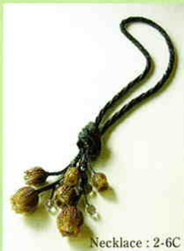
Necklace : 2-6C