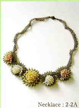
Necklace : 2-2A

基本ステッチをベースにして立体的なモチーフを作るワンランク上のアクセサリー。 ネックレス 6種、ブレスレット 1種。