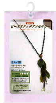
【販売スタイル】 縦約19.5cm×横約11cm