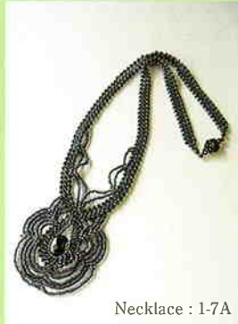
Necklace : 1-7A