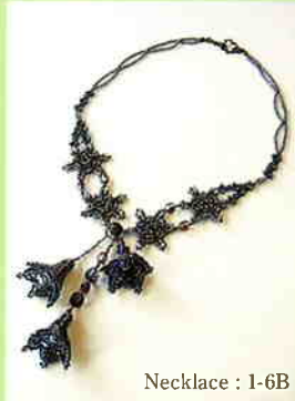
Necklace : 1-6B

基本的なステッチ（技法）がスパイスになるアクセサリーを提案しています。 ネックレス 11種、ブレスレット 8種。