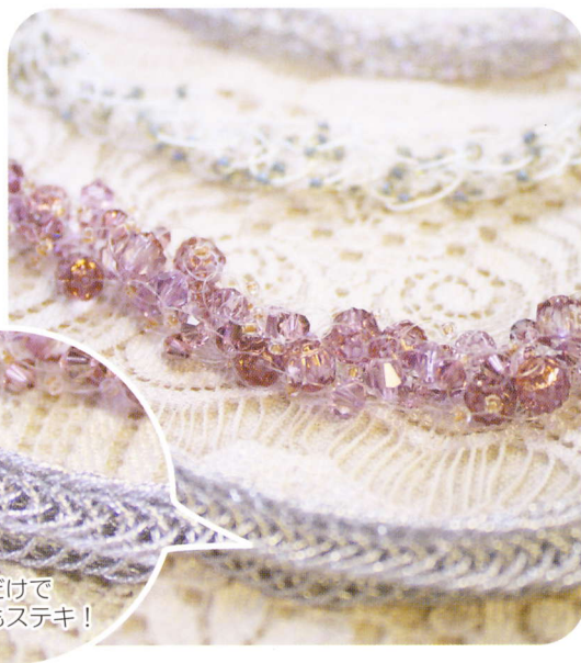
ラメ糸だけで編んでもステキ!