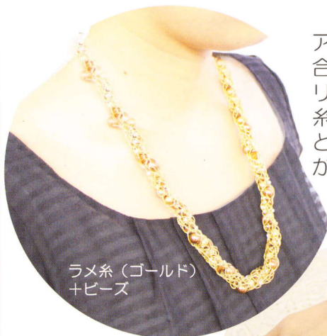
ラメ糸 (ゴールド) + ビーズ

アクセサリー作りに合わせて作られたリリアン。糸の巻き方を変えるといろいろな編み方が楽しめます。